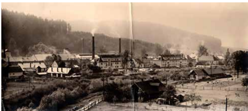
Pohled na parcely za Bečvou před zahájením výstavby rodinných domků z roku 1952.